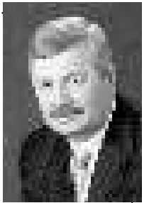
Владимир МЯКУШ, председатель Законодательного Собрания Челябинской области (фракция «Единая Россия»), секретарь Челябинского регионального отделения партии «Единая Россия»:

Как бы то ни было, такое предложение должно заинтересовать сту-