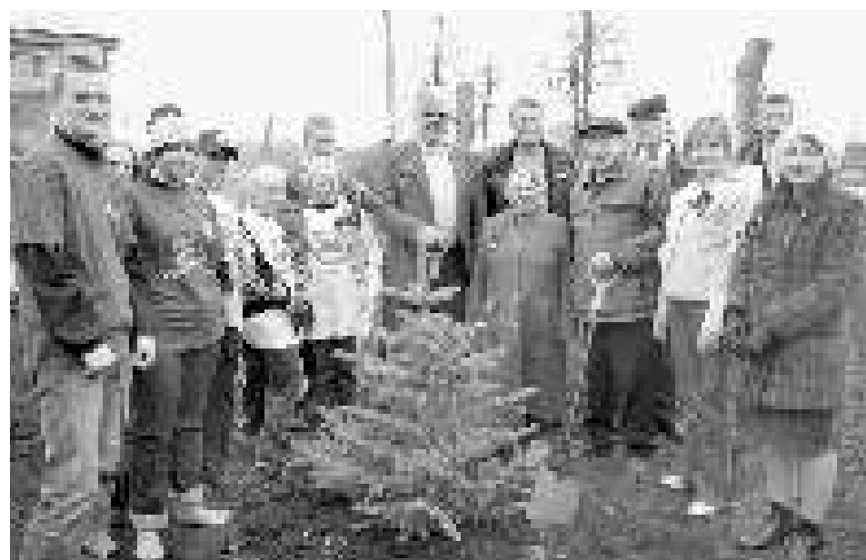
Посажена первая елочка.