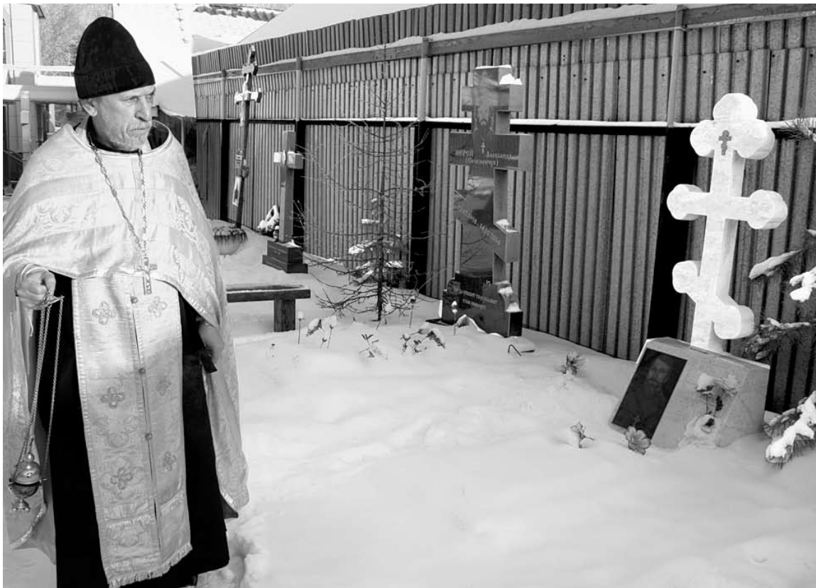
Некрополь для духовенства находится на территории церкви.

Наталья ФИРСАНОВА