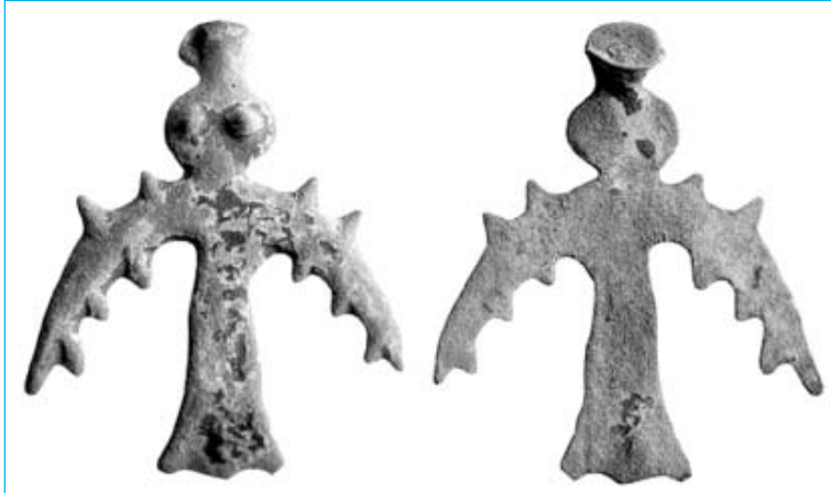
Знаменитые «люди-птицы», бронзовые статуэтки, изготовленные мастерами Иткульской культуры.

Среди известных памятников Иткульской культуры – десятки так называемых «городков мастеров», укрепленных поселений, обнаруженных на севере Челябинской области и в Притоболье, а также, как предполагают ученые, культовый объект Каменные палатки на озере Большие Аллаки.